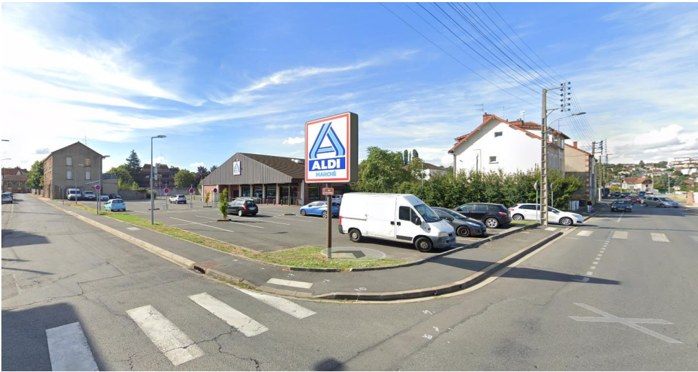
Environnement Vue 2 – Août 2022