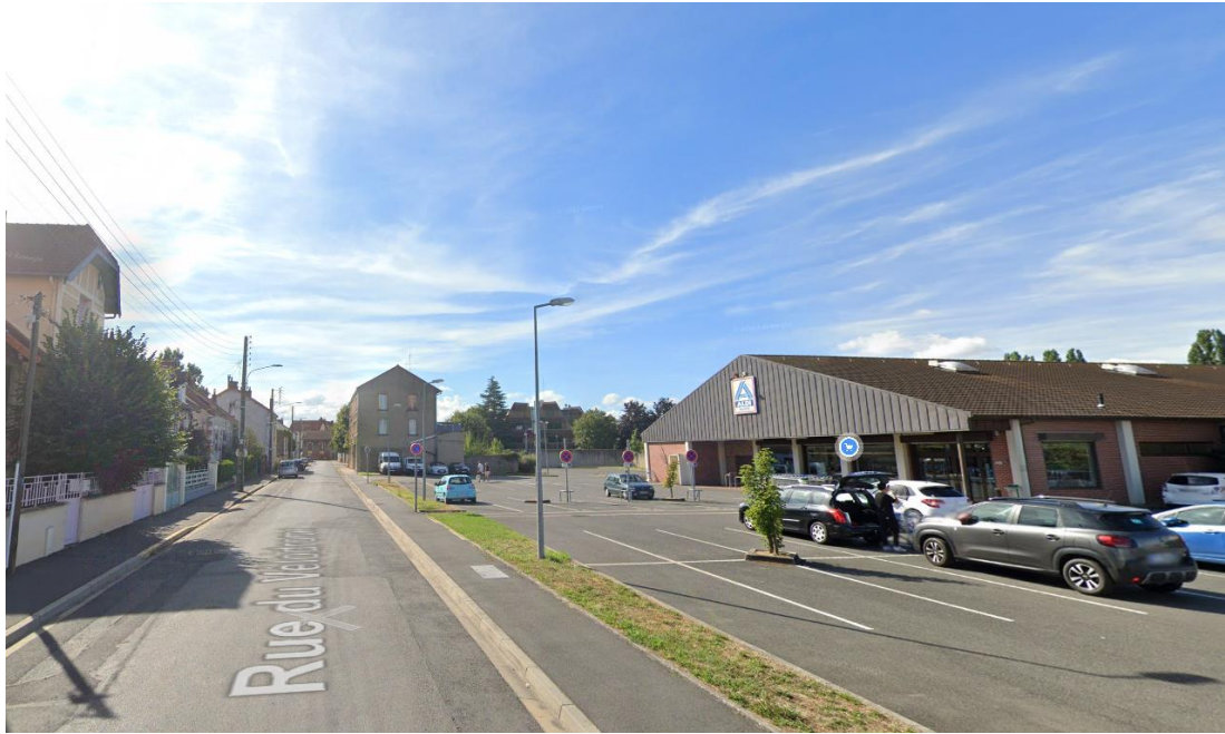
Environnement Vue 3 – Août 2022