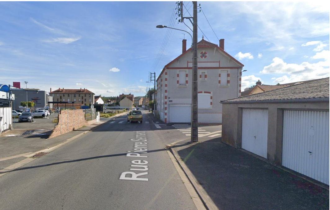
Environnement Vue 1 – Août 2022