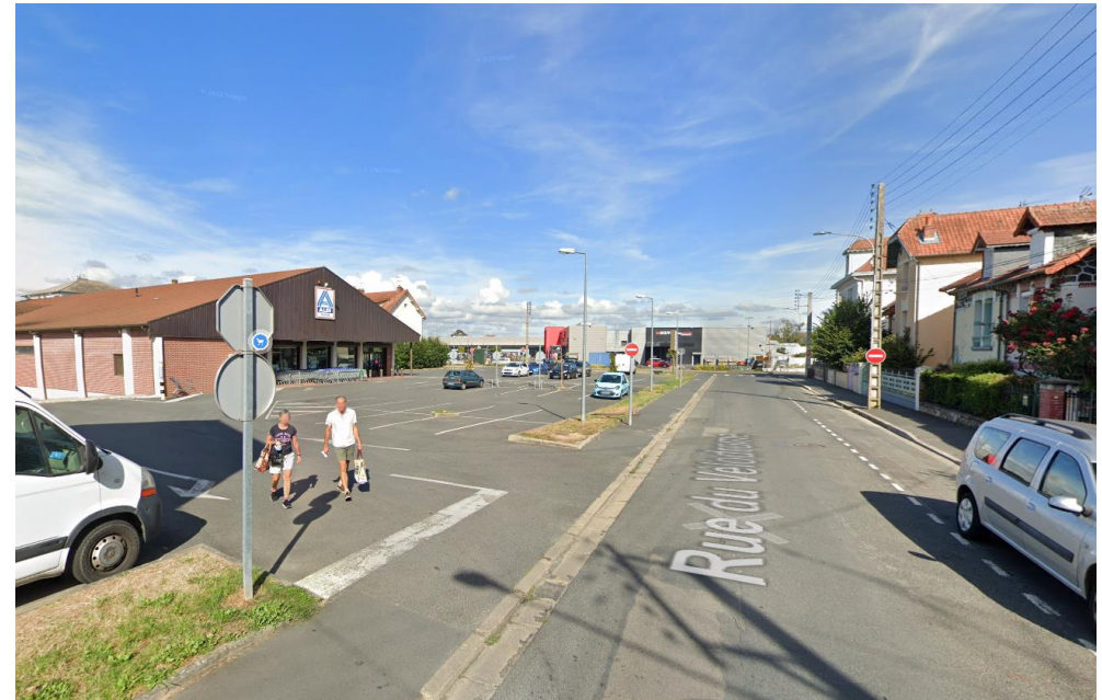
Environnement Vue 4 – Août 2022